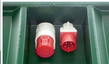
Tomas de corriente CEE integradas