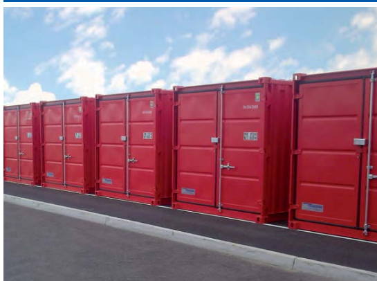
Almacén de materiales en la empresa