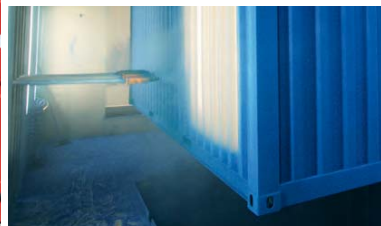
Lacado mediante pintura en polvo