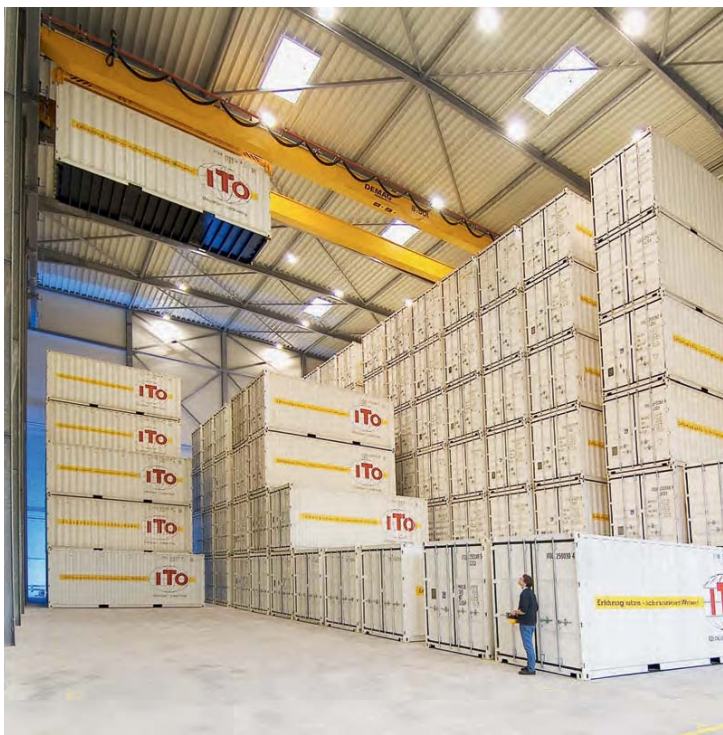
Perfecto aprovechamiento del espacio en almacén