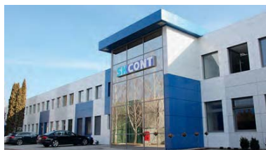
Planta de producción en Komarno (Eslovaquia)