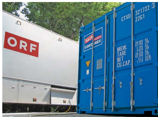
Almacén de equipos para eventos