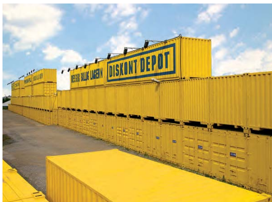
Conjunto para self storage