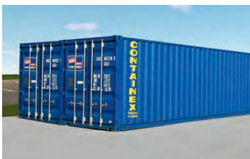
Contenedor marítimo de 40'