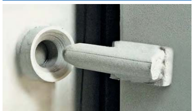
4 seguros antidesmonte incorporados