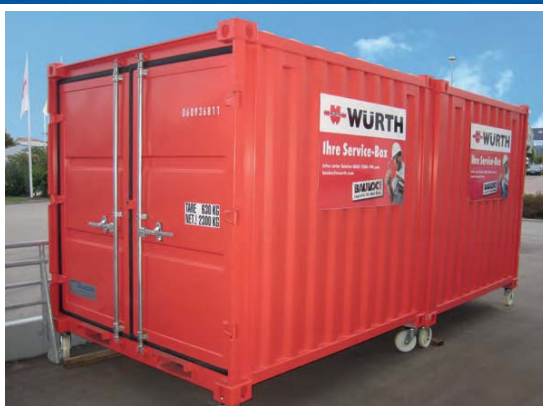
Contenedores de almacén con marca del cliente