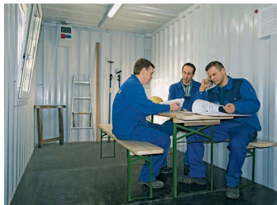
Sala de descanso en una obra