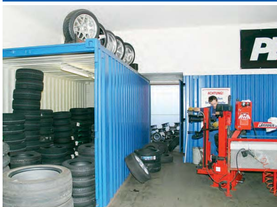
Almacén de neumáticos en el taller