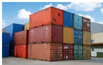
Contenedores marítimos usados