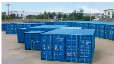
Almacén de self-storage