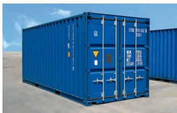
Contenedor marítimo de 20'