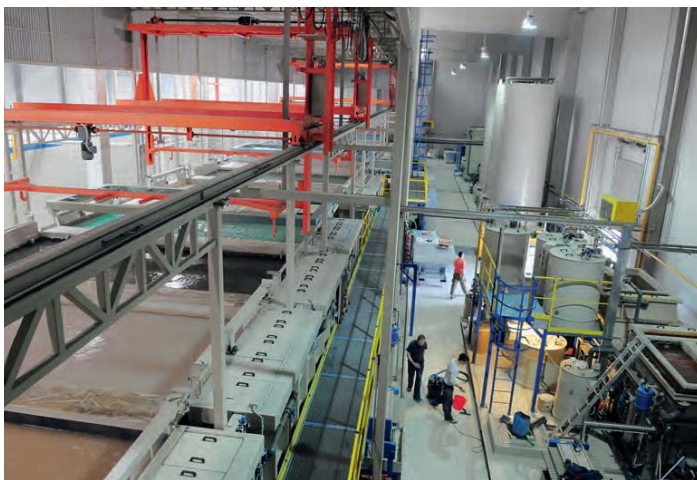
Instalación de pintado KTL