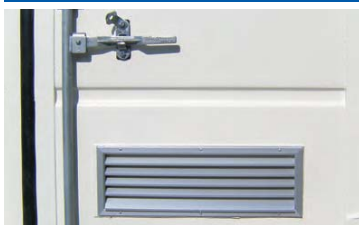
Rejilla de ventilación