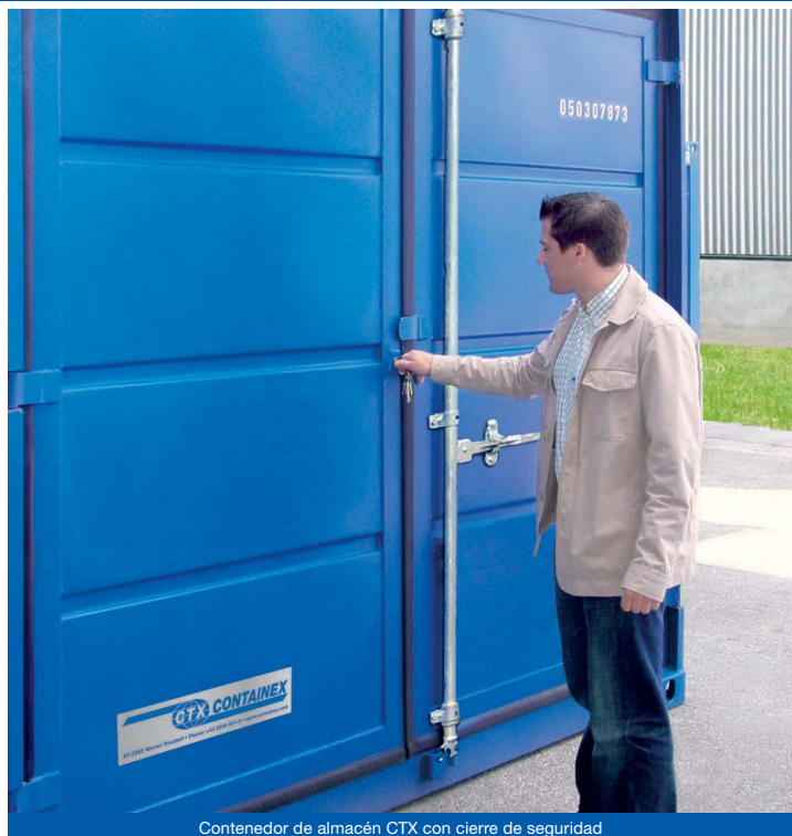
Contenedor de almacén CTX con cierre de seguridad