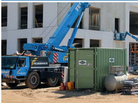
Utilización en obra