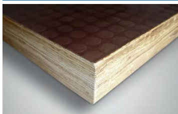
Piso de bambú con revestimiento antideslizante