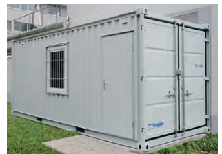
LC 20' con ventana y puerta