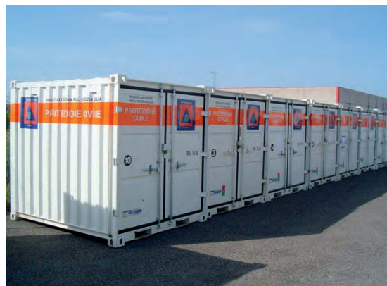
Contenedores de almacén en operaciones de emergencia