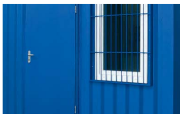
Ventana y puerta de entrada *