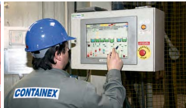
Alto grado de automatización de la producción