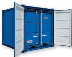
Ejemplo conjunto LC (LC 10' + 8')