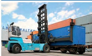
Carga de contenedores en el tren