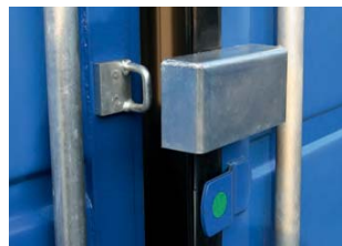
Protector antirrobo montado