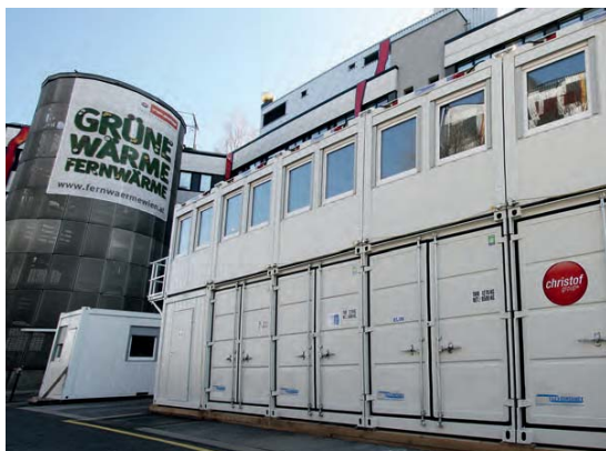
Almacén y oficina