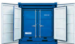
Ejemplo conjunto LC (LC 10' + 8' + 6')