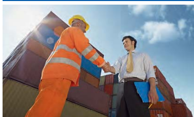
Depósito de contenedores