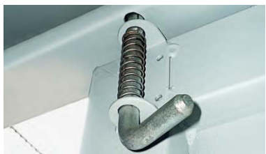
2 cerrojos interiores galvanizados incorporados