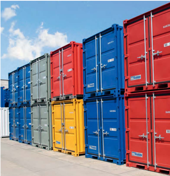
Diferentes colores conforme a la carta RAL de CTX