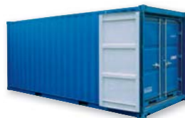
Ejemplo conjunto LC (LC 20' + LC 8' + LC 8')