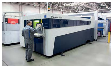
Máquina de corte por láser