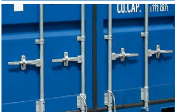
Barras de cierre cuádruples