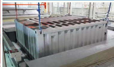
Imprimación electrostática en tanque de inmersión