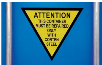
Chapas de acero corten