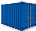
Tipo LC 10'