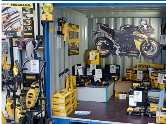
Contenedores de almacén como stand para ferias