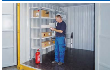
Sistema de estantes