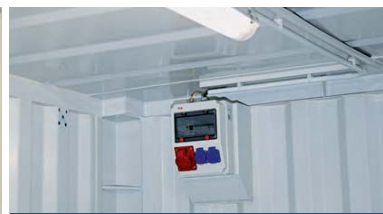
Fluorescente y caja de distribución con tomas de corriente